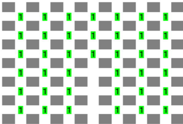
Estado inicial NO VÁLIDO